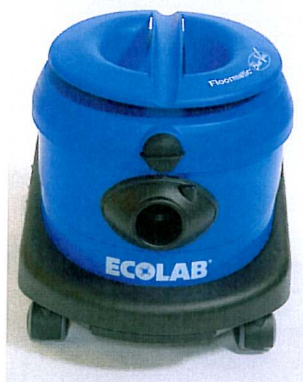
De 6 L capaciteit is een perfecte oplossing voor kleine en medium grote afdelingen.