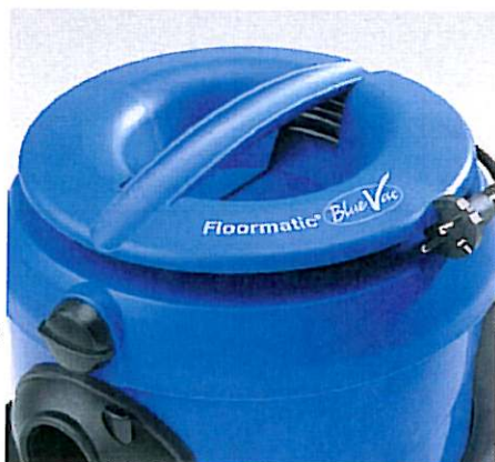
De on-board kabelopslag geeft een gemakkelijke en snelle reiniging en een gefaciliteerde opslag.