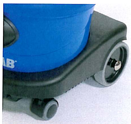
Het lage punt van de zwaartekracht, de twee grote achter- en twee draaibare voorwielen verzekeren een stabiele en goed manoeuvreerbare basis.