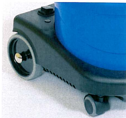
Het niet afgevend plastic garandeert de bescherming van meubilair.